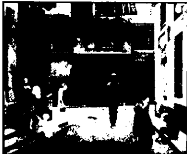
Balthus, Le passage du commerce-Saint-André , 1952-54. Óleo sobre tela, 230x294 cms.