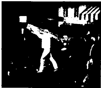
Balthus, Le rue , 1933. Óleo sobre tela, 193x294 cms.