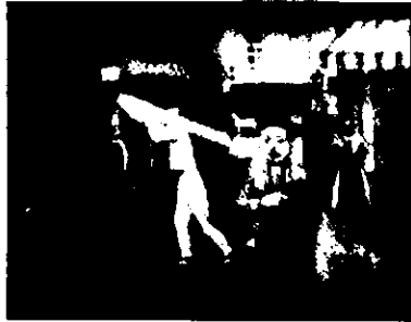
Balthus, La rue , 1929. Óleo sobre tela, 130x262 cms.