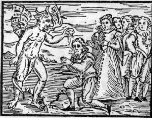
...están hechos para ser rebautizados en nombre del demonio...