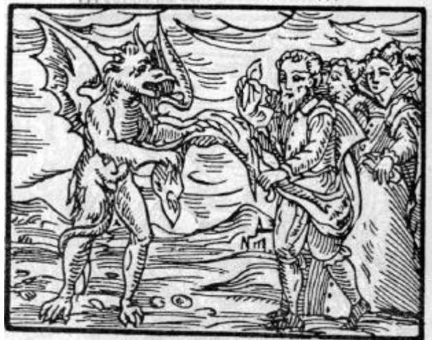
...entregan sus ropas al demonio...