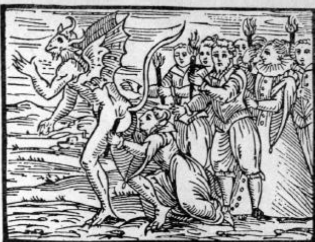
...besan las partes traseras privadas del demonio...