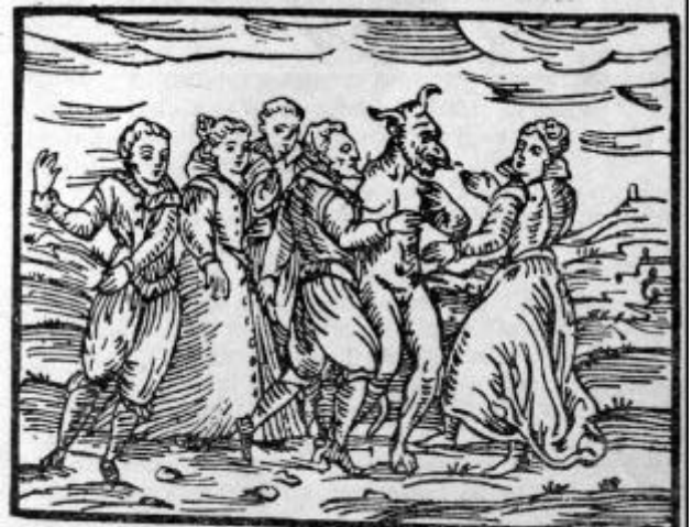
...y bailan en círculo, espalda contra espalda...