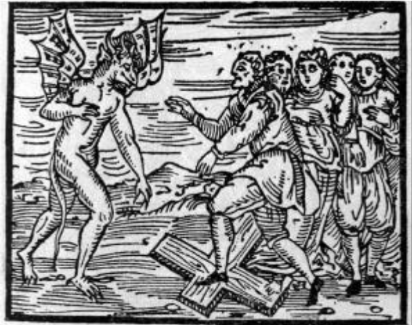
...pisotean la Cruz...