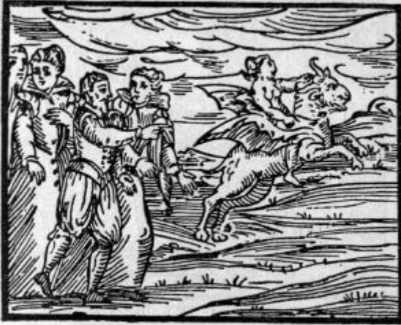
...vienen cabalgando en chivos...