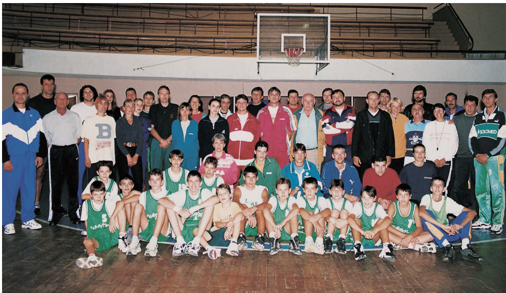
Participantes búlgaros en el programa Young Coaches 2000 de la FIBA.

Desde los 15 años en adelante, el trabajo a realizar debe ser más analítico e individualizado, considerando lo que cada jugador necesita para poder seguir progresando. En esta etapa, el tiempo de entrenamiento debe dedicarse, en gran parte, a perfeccionar detalles esenciales de los fundamentos del baloncesto. También es importante trabajar más específicamente para el desarrollo de la toma de decisiones tácticas y abordar la enseñanza progresiva del juego de equipo, con conceptos más básicos cuando se trabaja con jugadores de 15-16 años, y otros más avanzados en el caso de los jugadores de 17-18 años.